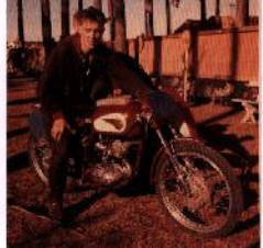
Ovan: NV:n som låg tillgräddan för TT-mysteriet.